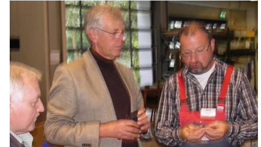
Kompetenz der Region nutzen.