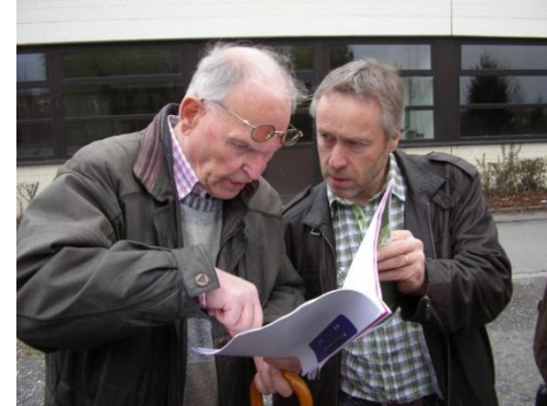
Unser Flächennutzungsplan ist veraltet – neues Denken ist gefordert